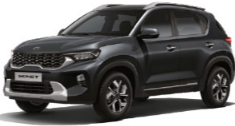
Gris Gravedad (KDG)