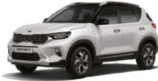
Blanco Glacier Perlado (GB2)