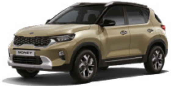
Beige Dorado (GC1)