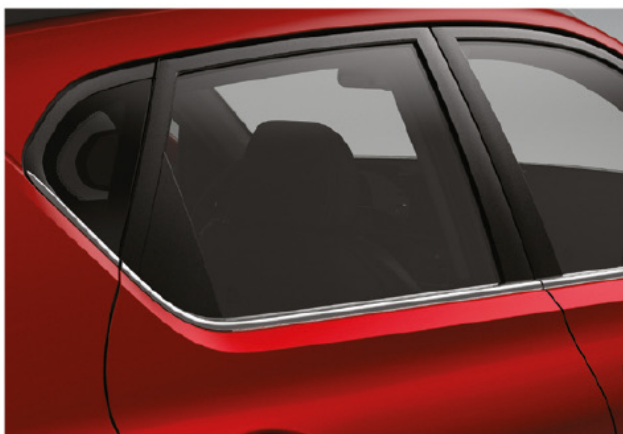
Moldura de beltline en cromo