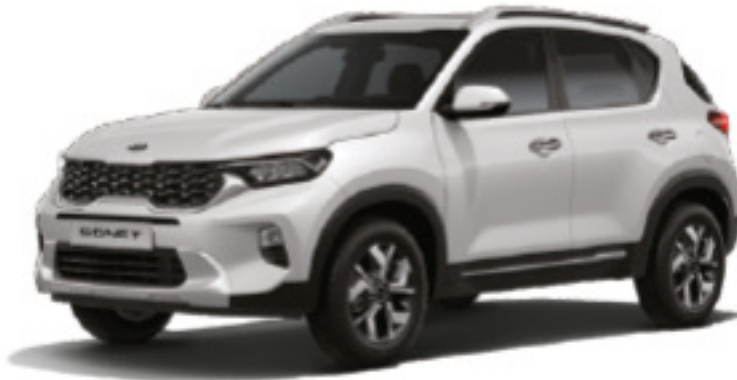
Blanco Glacier Perlado (GWP)