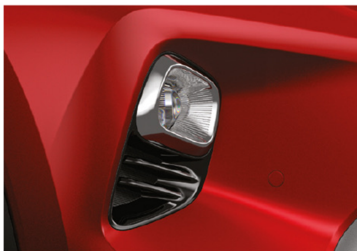
Faros antiniebla de proyección