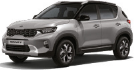
Plata Acero (GB1)