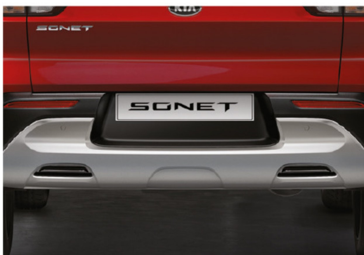
Parachoques trasero y placa protectora