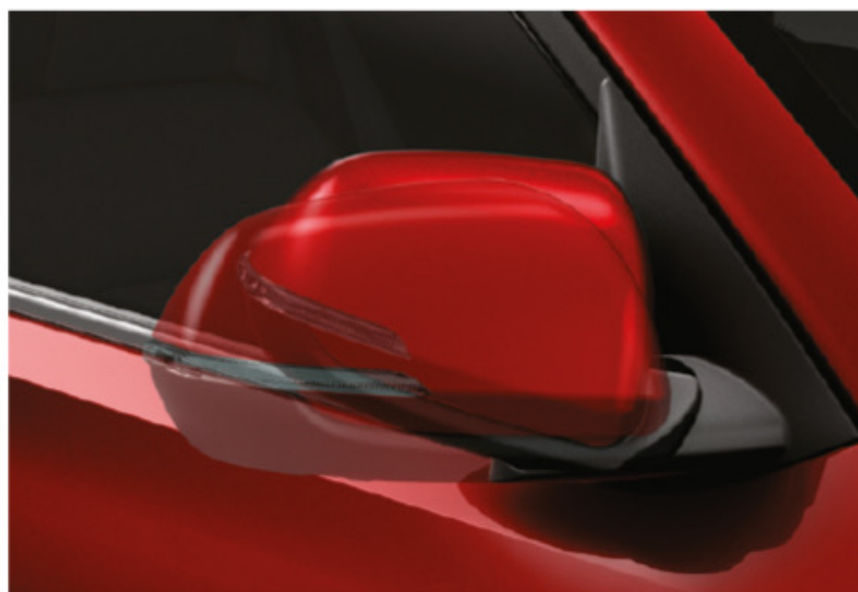
Retrovisores exteriores automáticamente plegables