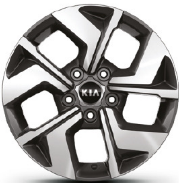
Rueda de Aleación de 16"

※ Toda la información contenida en este catálogo está basada en datos disponibles al momento de la publicación. Las descripciones se consideran correctas y Kia Motors Corporation se esfuerza por mantener la precisión, sin embargo, la exactitud no puede garantizarse. De vez en cuando, Kia Motors Corporation necesita actualizar o modificar las características e información del vehículo ya mostradas en este catálogo. Algunos vehículos presentados incluyen equipamientos opcionales que pueden no estar disponibles en algunas regiones. Todas las imágenes de video y cámara son simuladas. Kia Motors Corporation por medio de la publicación y distribución de este material no crea garantía, expresa o implícita, para cualquiera de los productos de Kia. Contacte a su concesionario local para obtener la información más actualizada.