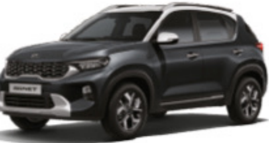
Gris Gravedad (GB4)