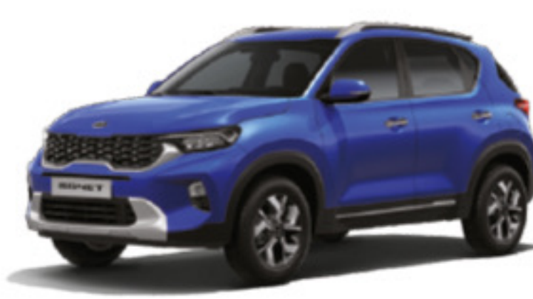
Azul Inteligente (BNB)