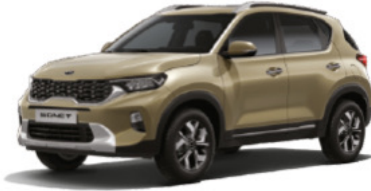
Beige Dorado (QYG)