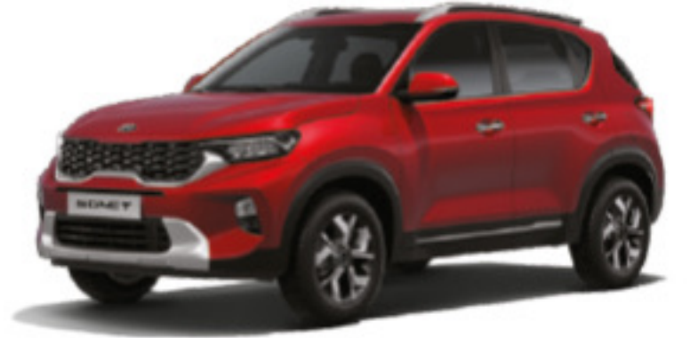
Rojo Intenso (A6R)