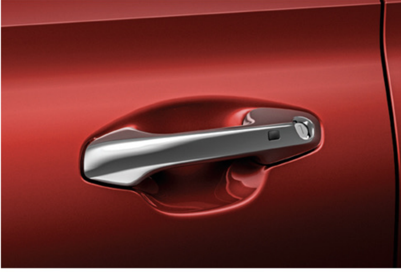
Manijas exteriores de puerta cromadas