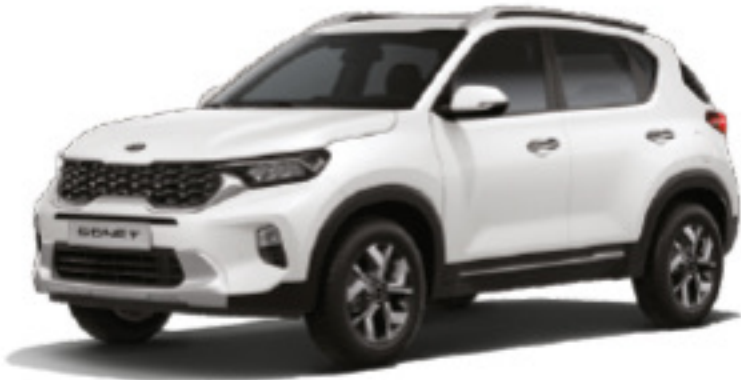
Blanco Claro (UD)