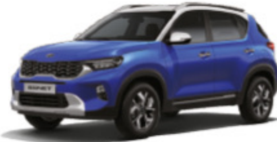
Azul Inteligente (GB6)