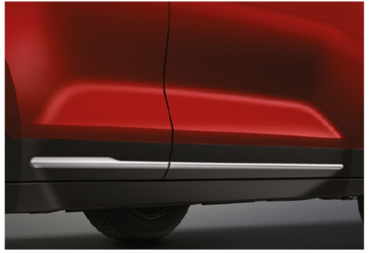
Moldura decorativa de puerta