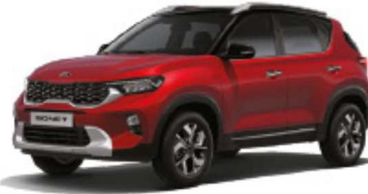
Rojo Intenso (GB3)