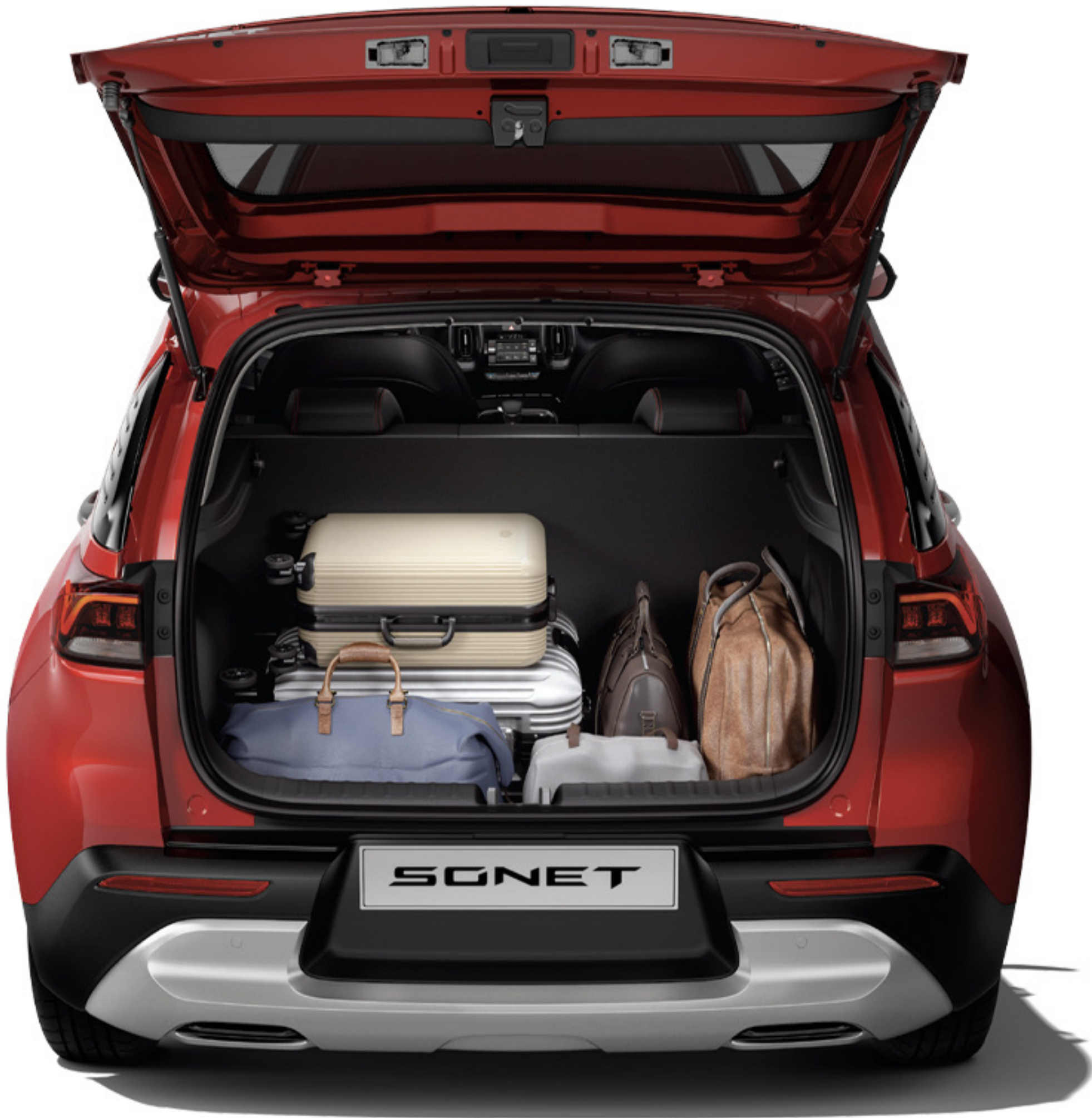
392ℓ de capacidad de carga