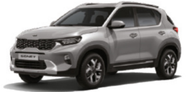
Plata Acero (KLG)