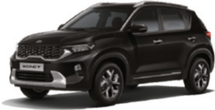
Aurora Negra Perlada (ABP)