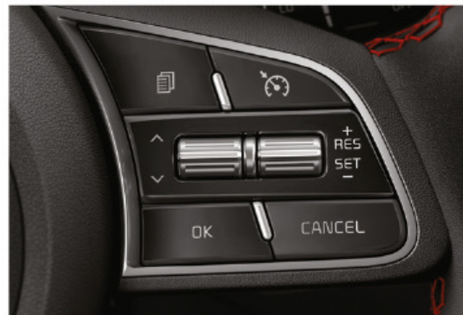
Control de crucero