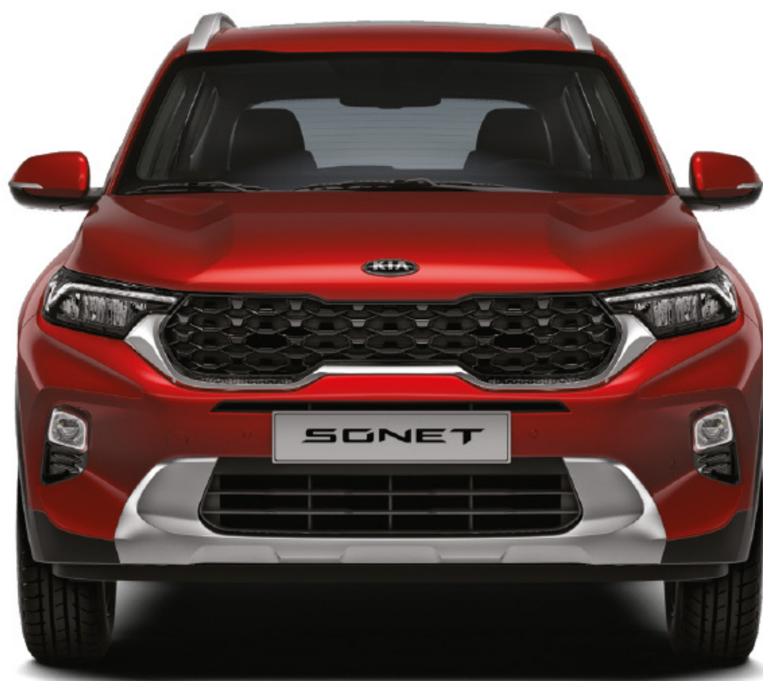
Rejilla / Parachoques frontal y placa protectora

Tal vez usted está en el marco de su propia expedición o simplemente quiere sentirse preparado para una. El Sonet está disponible con opciones interiores y exteriores así como accesorios para aquellos motoristas que estén listos para explorar tanto las carreteras secundarias como los bulevares de la ciudad.